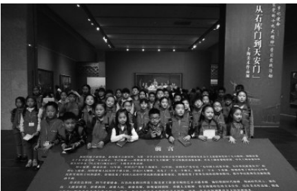
*小记者走进中华艺术宫，参观学习从石库门到天安门的大型艺术展览。