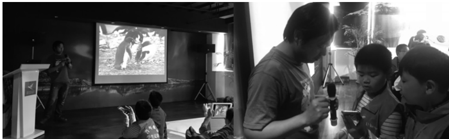
*小记者与摄影家徐征泽互动交流，徐老师曾13次前往南极和北极，30多次前往非洲、足迹遍布全球近50个国家和180多个地区，摄影作品荣获国际、国内十余次大奖。