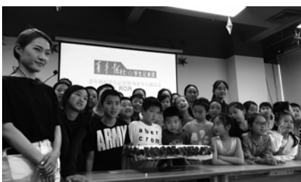
*今年五月小记者们一起庆祝母亲节，献给妈妈一份特别的爱！