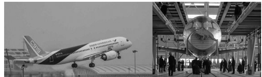
*今年暑假，小记者将走进大飞机研发与组装基地，圆一个蓝天梦，坐飞机不稀奇，亲眼看着大飞机的诞生，就是一次终生难忘的经历！

我们的小记者新闻训练营除了有专业的新闻采编理论学习和阅读写作的专业训练之外，我们更有丰富多彩的系列活动，一起来看看我们春、夏季营的活动吧！