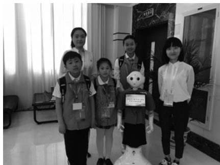
*今年五月小记者走进中国共产主义青年团上海市第十五次代表大会，采访优秀团代表，并与智能机器人团团合影。