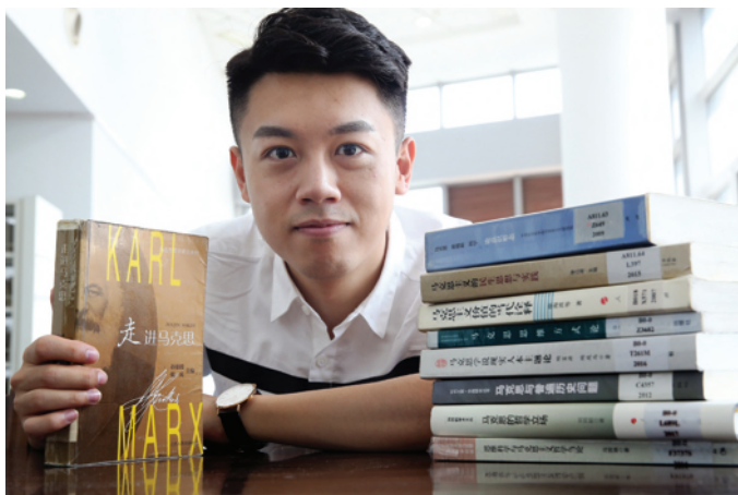
为了讲好马克思,他从图书馆借了一大堆有关马克思的书籍。