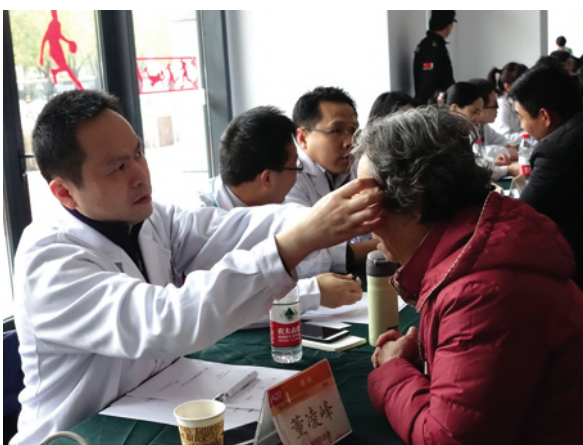
医生正在为社区老人服务。

2016年，该项目获得上海市科委高度肯定，获得上海科普教育创新奖科普贡献奖（组织）一等奖。“但仅仅是阶段性的成果，”市卫生计生