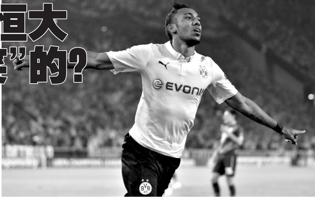
多特蒙德CEO瓦茨克在接受采访时对奥巴梅扬的转会传闻予以了辟谣。

上个周末,关于前德甲金靴奥巴梅扬将在今年夏天转会恒大的消息如一颗重磅炸弹,在中国足坛引起巨大反响。无论是高达7000万欧元的转会费,还是奥巴梅扬本身的实力,在中超层面都是首屈一指的。