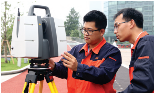
测绘人员在现场进行激光测绘。