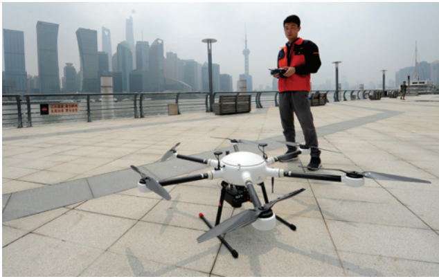
工作人员航拍测绘。