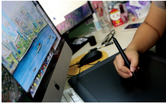
手绘人员把收集来的数据照片进行电子手绘。