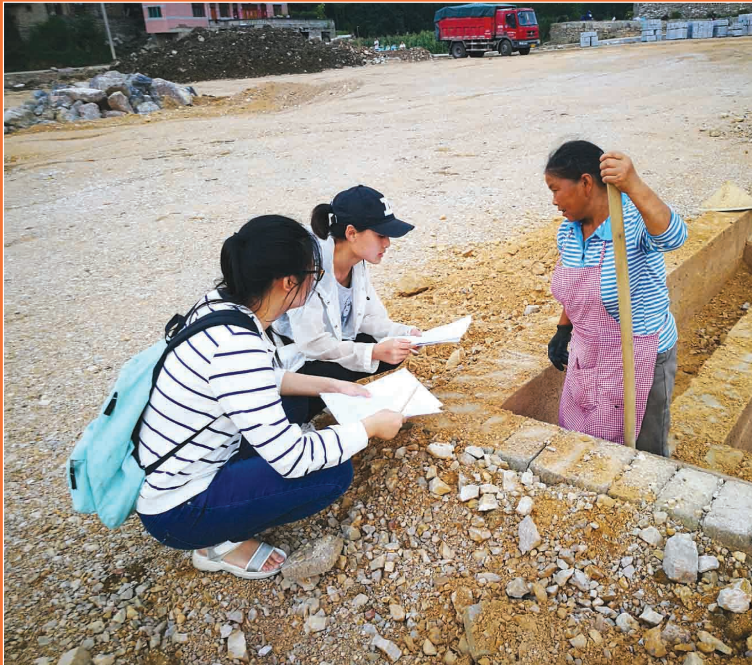
上海大学社会工作专业的学生,深入乡村进行调研。