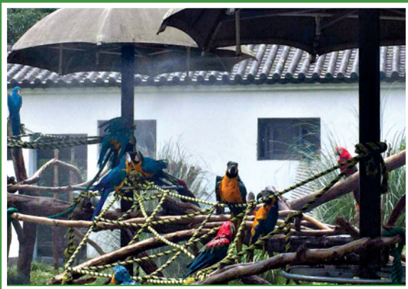
鹦鹉在喷雾下消暑。