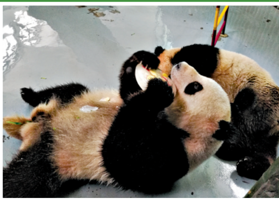
大熊猫在吃冰镇果肉。