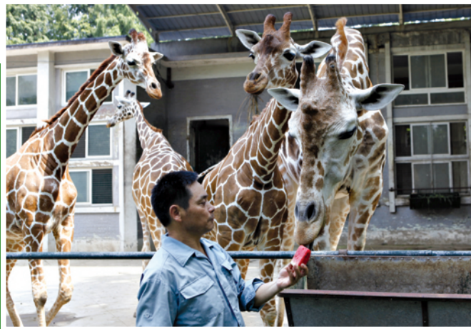
饲养员在喂长颈鹿西瓜。