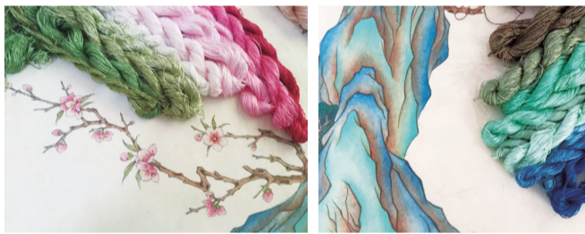
《桃花源》系列创作配色过程

历时五个月的缂丝融合跨界探索成果, 旗袍鞋履之上桃花源, 于八月底在上海设计周优雅亮相。我们牵手设计师与手艺人, 组成跨界设计团队, 帮助中国古老的缂丝工艺走进现代时尚生活, 寻找心中那片“芳草鲜美, 落英缤纷”的桃花源。