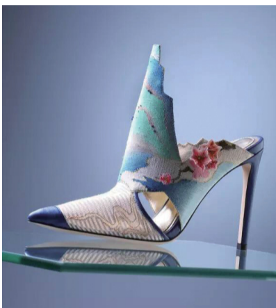
缂丝女鞋《桃花源·寻迹》