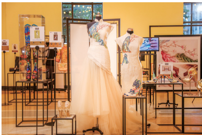
缂丝旗袍《桃花源·寻》、缂丝礼服《桃花源·梦》