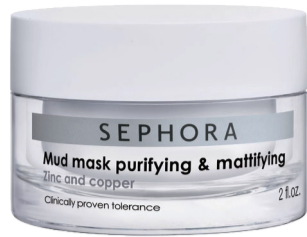
丝芙兰净化控油泥膜RMB139/60ml

三七分或中分的复古短发一直都是最干净清爽的，但操作这个发型(尤其是直发)一定要注意，千万别让头皮泛油光，这在夏天可是大忌。选择控油、舒缓的洗发水，或是巧妙运用一些头皮控油的产品，让头皮一整天都能保持干爽。这样的中分(或三七分)才会显得清爽利落。