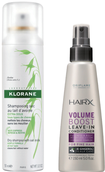
康如柔润倍护免洗喷雾 RMB98/150ml