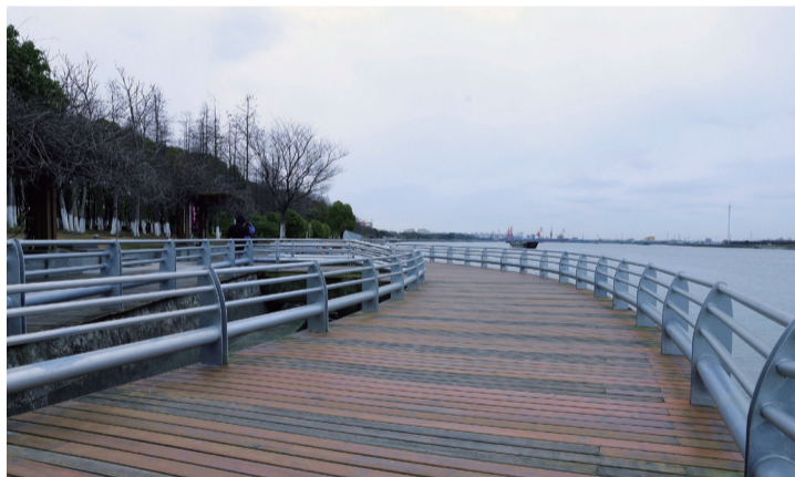
紫竹滨江公园的临水步道是全上海最亲近黄浦江的地方。

小小一块地方包含传统元素用“亩中山水”再现中国传统名园中深入人心的场景，力图以现代理念展现传统园林元素。方寸之间，将场地规划为两个部分：静谧幽雅的竹林和深藏其中的体现中国传统韵味的九亩园林。两者相互包容，形成有机整体，提供了漫步、穿越、赏园、休憩、观江等多种活动方式和游览路线。九亩中国园林，合为一个整体，周边则以单纯的竹林围合，造成幽深的意境，园内的景观建筑追求当代性和中国意味相融合。一轩、一桥、一廊、一亭点出诗情画意，一石、一树、一池、一花绘出山水灵气。漫步九亩之中，仿佛穿梭于古今，前人的情怀、今人的希冀交相辉映。