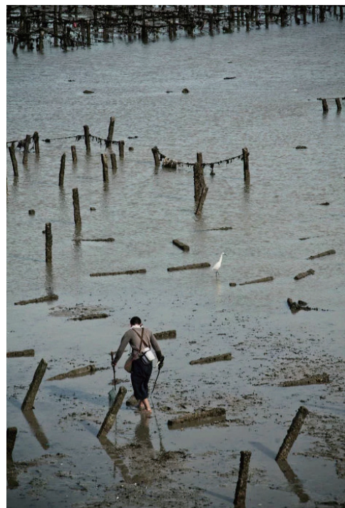
走入后滩的滩涂，走入黄浦江。