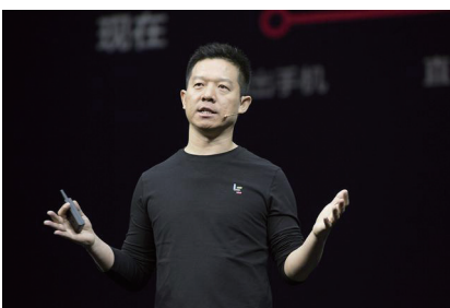
乐视创始人贾跃亭

据悉，乐视VR生态以平台、内容、软件、硬件、服务，构成虚拟现实的完整体验，让用户感受到科技潮流的魅力。平台方面，乐视垂直整合VR全行业价值链条，领跑中国VR行业；内容方面，乐视拥有海量独家版权VR片源，以及国际化精品内容。终端方面，第一代终端产品——VR头盔LeVR COOL1得到市场初步认可。