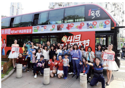
1号店419掌上狂欢节上海巡游活动

这个四月又热闹起来，先有京东发布3C战略，后有国美在线4·18五周年生日趴，天猫苏宁合体“New Buy”轰轰烈烈，电商造节这把火愈演愈烈。而就在各家争夺“3C家电”的主战场时，1号店另辟蹊径，1号店419掌上狂欢节拉开帷幕，邀请全国网友们加入到一场移动购物特别活动中来。