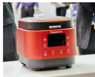
伊莱特“聚能炭鼎”电饭煲

“竟然是毛竹为原料做出来的,真的是高大上”。在2016年中国家电博览会上,伊莱特一发布“聚能炭鼎”IH竹炭煲,就引起参展媒体、观众的纷纷赞叹。