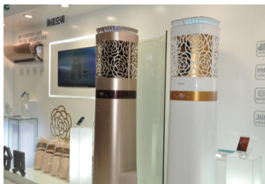
海信空调炫转空调2016年新品

3月9日,海信2016年空调新品,升级版的“炫转”空调亮相展会现场,以智能体验、360度送风系统、山茶花外观等独特优势在