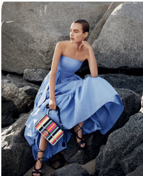
Salvatore Ferragamo全新的2016春夏大片“璀璨人生”，展现了环球旅行者们不惧岁月的精致生活方式。