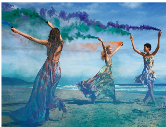
ZARA 2016春夏系列最新大片。