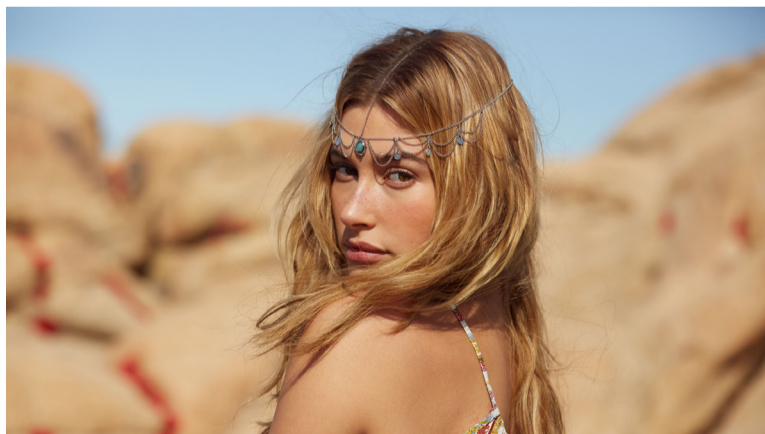
H&M再次与柯契拉音乐节合作，联名推出一个面向青少年男女的服装系列，并在各大社交平台上推出#HMLovesCoachella标签。