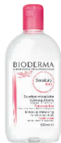
贝德玛舒妍多效洁肤液500ml

第二天醒来之后,吃个营养早餐,然后一边进行休闲活动一边敷个保湿面膜,为肌肤迅速补水,让细胞迅速恢复水分饱和的状态。