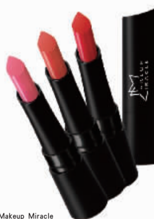
Makeup Miracle 哑光持色唇膏2g 99元/件

宴会/party和上班是女士们最主要的化妆场合,在万圣节这么嗨的节日你能耐得住素颜吗?屈臣氏和尼尔森的“国民美颜大调查”发现,57%中国女生有化妆习惯,同时61%男生认为女友/老婆化妆十分有必要。百变的万圣节妆容技巧必须get√,但是万变不离其宗,大浓