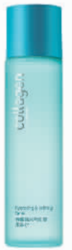
屈臣氏骨胶原水盈细致柔肤水 150ml 89.9元/件

天必须要化上厚重眼妆,这时候使用眼部护理组合,会使你的眼睛看起来更加活力动人呢!屈臣氏提醒你,学习眼霜按摩法,有助眼部更好吸收营养精华。