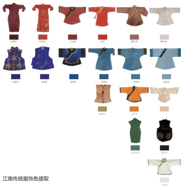
江南传统服饰色提取