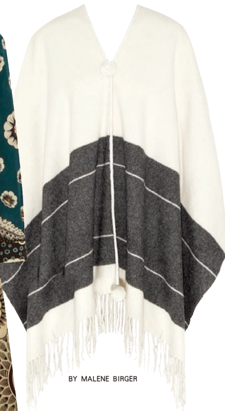
BY MALENE BIRGER