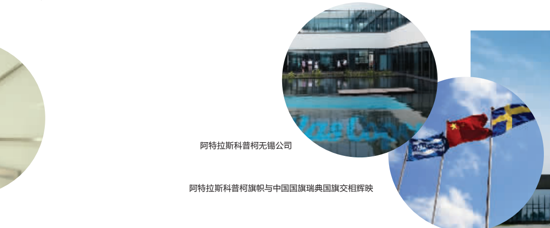
阿特拉斯·科普柯无锡公司