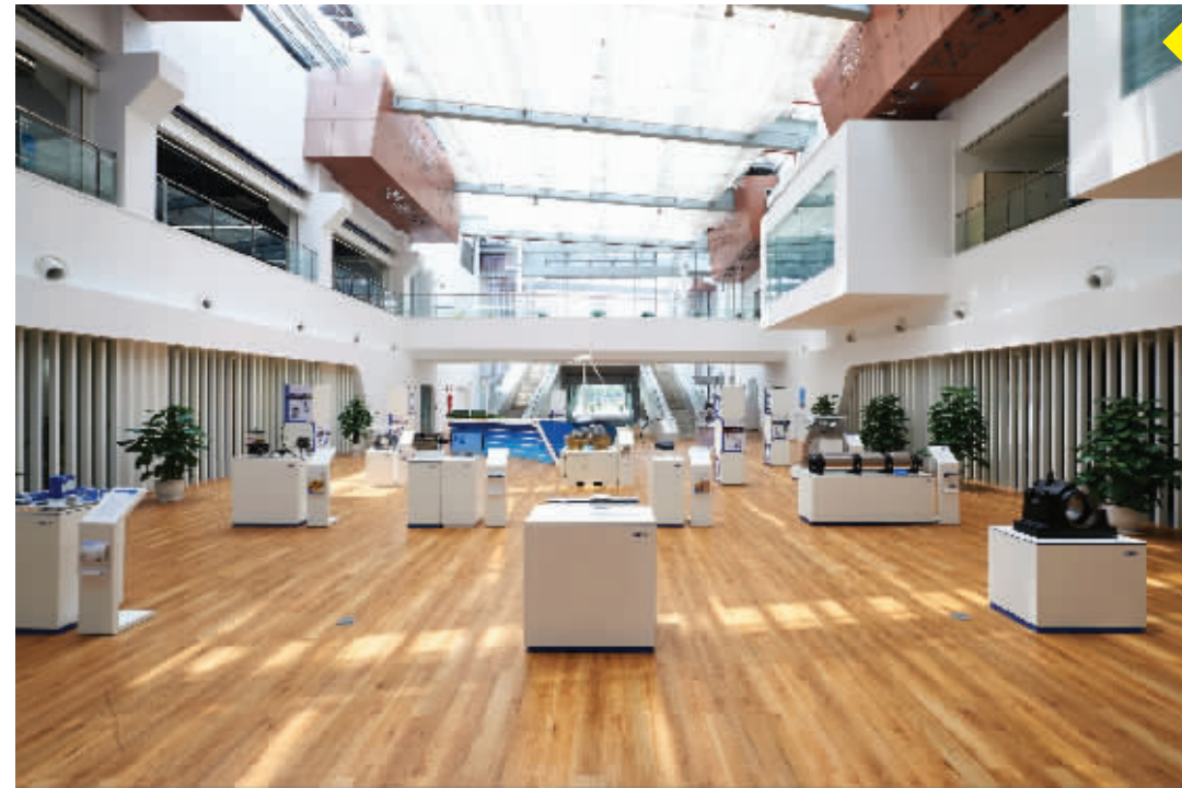
斯凯孚上海办公室