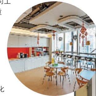
沃尔沃北京办公室

正是由于多样化的人员组成和交流,不同的思想、文化得以互相交融、碰撞。适当地融入便成了必须。爱立信的谈今说:“在瑞典大家下了班各回各家是很常见的,经理不会跟员工一块出去吃饭。但在中国,一起组织一下团队建设被认为是一个非常重要的方面。也并不特别强调在中国就一定要有一套中国的模式。因为本身就是一个国际化的团队,也就是说在中国工作的经理可能是一个欧洲人,或者说这个经理虽然是中