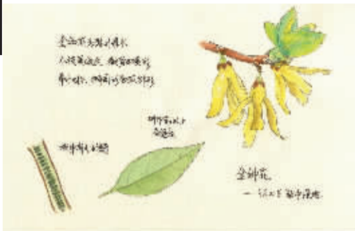
特邀任众为生活周刊读者绘制