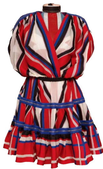
JEAN PAUL GAULTIER