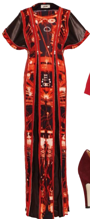
JEAN PAUL GAULTIER

羊毛和羊绒的混纺轻柔而又保暖,自然成为了女孩们的首要选择。紫色夹杂着粉色的混纺让青春已过,轻熟未到的女孩们找到了自己的色彩;藕色中混放入了一些金色的丝线,让整件衣服瞬间变得更加高贵,同时也打破了单调的感觉。