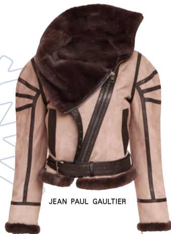
JEAN PAUL GAULTIER