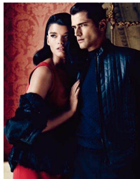
墨西哥时尚品牌El Palacio de Hierro的2014圣诞大片, 由超模Crystal Renn与Sean O'pry共同出镜代言, 时尚摄影师Dean Isidro执镜。