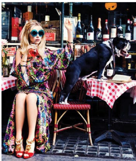
当红英伦超模It Girl Suki Waterhouse拍摄的一组以「New Queen」为主题的时尚大片,Suki身着Prada外套以上世纪60年代风情出镜,演绎新的“英伦女王”。