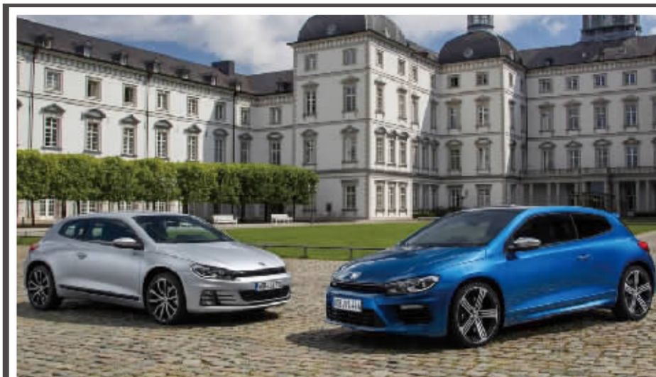
2008年,大众前驱运动轿跑Scirocco推出了第三代车型,随后将其命名为“尚酷”引入中国市场。自此,这股欧洲的“热风”便开始席卷中国市场。

新尚酷R在外观上基本保留了老款车型上的经典元素,仅在一些细节部分进行了修改,运动感有增无减。改款后的尚酷R最大的变化在于车辆前脸,棱角分明的结构充斥着许多极具攻击性的线条,而重新设计的进气格栅以及保险杠样式使全系车型显得更加运动。新车中网采用黑色横条式的样式,并在上面标注出R版专属标识。下中网则采用外扩式的设计,体现出更加夸张霸气的风格。雾灯区被三道利刃分割成三部分,并将雾灯和转向灯集成在上面的格子中,下面全部设计成进气口。全新样式的18英寸轮毂设计感很强,浮雕般的三股五辐样式看起来更加前卫。尾部依然保持了紧凑敦实的风格,尾灯的造型经过全新设计后,个性时尚,并且与整车硬朗的线条相呼应。新尚酷R提供了具有强烈运动氛围的黑色内饰,细节处的材质质感也有所提升。加上大量银色镀铬和钢琴漆面板作为装饰,内饰的整体风格不再那么千篇一律。这款车采用了全新样式的方向盘,新的方向盘下部采用平面化的设计,更符合轿跑车的定位,方向盘中间呈简单的圆形并向内凹陷,据称这项设计源于复古的老爷车。R标识仍然出现在方向盘下方,证明这款车的不同之处。另外一