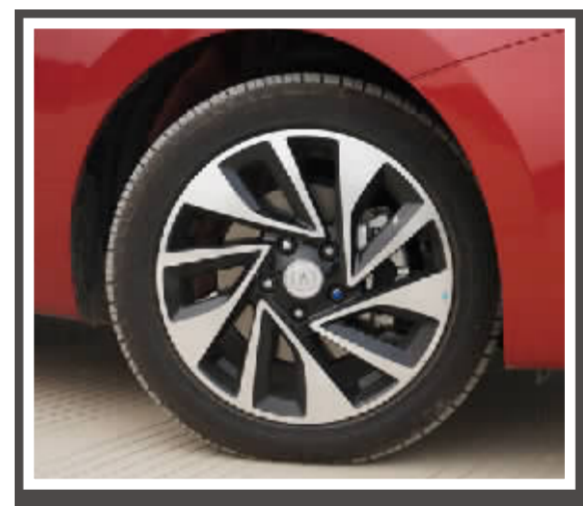
长安汽车家用领域近几年先后推出了多款车型,它的进步是有目共睹的。如今,长安汽车继续发力,又推出了新的紧凑型轿车长安悦翔V7。

在此前成都车展上首次亮相的长安悦翔V7,凭借极具特色的造型,吸引了众多消费者的关注。新车将目标客户定位于85-90后的年轻群体,并且打出“YOUNG,就是不一样”的口号。长安悦翔V7的造型综合了日系的精细与欧系的时尚,展翼式前脸配合倒梯形设计的进气格栅,展现出不俗的时尚感与整体感。犀利的大灯轮廓配以镀铬的灯眉和淡蓝色灯圈,看上去炯炯有神。车身侧面采用了前低后高的设计,使得车辆有前冲的效果。轮毂采用涡轮状五幅