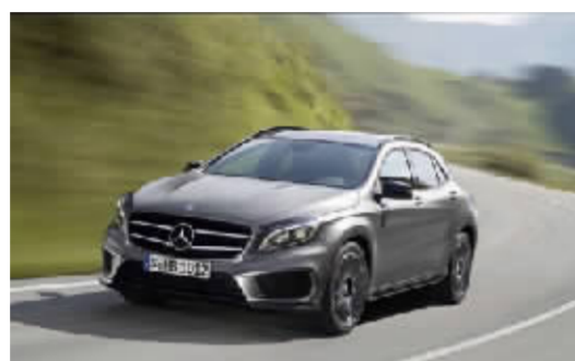
点评:GLA的外形突显了运动化、年轻化的设计理念,对年轻消费者拥有很大吸引力。