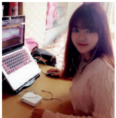
《一颗樱桃在韩国》主播:樱桃