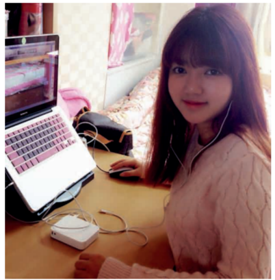
《一颗樱桃在韩国》主播：樱桃