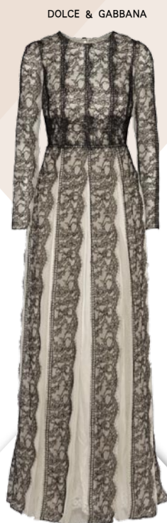
DOLCE &amp; GABBANA