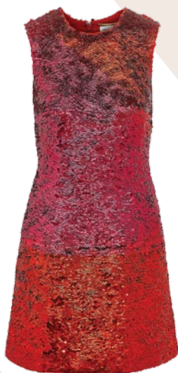
MARC BY MARC JACOBS