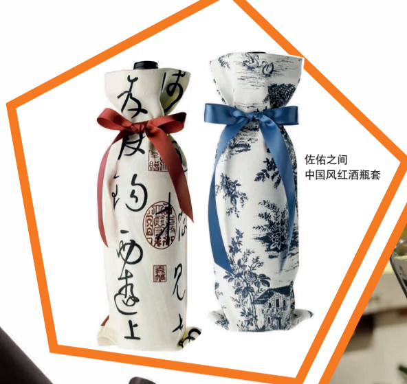
佐佑之间 中国风红酒瓶套