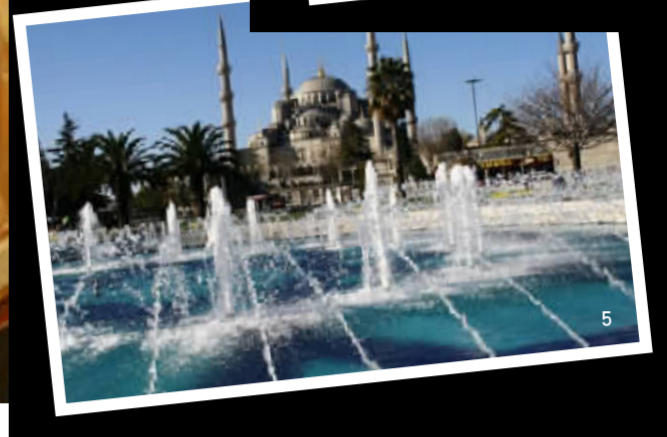
1. 托卡普皇宫。 2. 修缮中的圣索菲亚大教堂。 3. Chora教堂壁画。 4. 蓝色清真寺。 5. 伊斯坦布尔街景。

然而,当我利用城市导航App离线地图功能很快找到了自己的客栈,老板亲切地恭迎并对着地图力图向我絮絮叨叨关于伊斯坦布尔的一切,我在客栈楼下买到了好吃又便宜的鸡肉卷,我去小超市买1.75土耳其里拉的牛奶,只拿得出1.25里拉的零钱,伙计只收了1.25里拉,对我说“0.5明天再给”,就好像我是原住民……当这些小事渐次发生的时候,我又仿佛被这座“破败”城市的温情融化了。