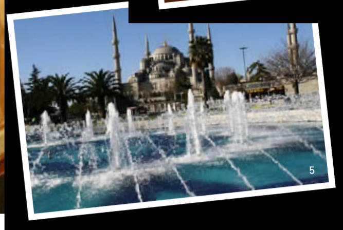
1. 托卡普皇宫。 2. 修缮中的圣索菲亚大教堂。 3. Chora教堂壁画。 4. 蓝色清真寺。 5. 伊斯坦布尔街景。

然而,当我利用城市导航App离线地图功能很快找到了自己的客栈,老板亲切地恭迎并对着地图力图向我絮絮叨叨关于伊斯坦布尔的一切,我在客栈楼下买到了好吃又便宜的鸡肉卷,我去小超市买1.75土耳其里拉的牛奶,只拿得出1.25里拉的零钱,伙计只收了1.25里拉,对我说“0.5明天再给”,就好像我是原住民……当这些小事渐次发生的时候,我又仿佛被这座“破败”城市的温情融化了。