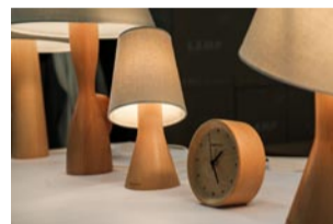
本来设计的木质家居用品

一年一度的时尚家居展刚刚落下帷幕,在这个汇聚250家参展商,国内外众多知名家居品牌的家居盛会中,我们不但可以看到高端家居的潮流趋势,还在以“设计好时光”为主题的三大设计专区中和“Talents 设计新星”面对面接触,亲自体验年轻设计公司的“Next未来品牌”的新品,而成熟设计师品牌的“Loft精品设计”更让你了解到设计如何和家居生活紧密结合。