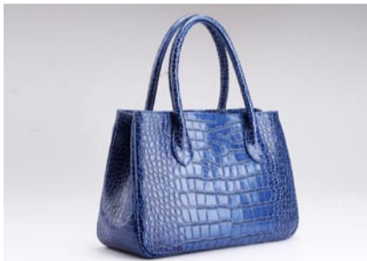
蓝色鳄鱼纹牛皮包

为什么我们喜欢单肩包,为的是简单、干净、利落。粉红色的单肩包满足了干净简单的气质,帝王黄的颜色给人干练独特的独立。