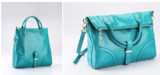
可折叠油皮两用包

参加晚宴,美丽的晚礼服,不管旗袍还是其他,这款真丝水钻绝对好搭。香槟色,皓月白,尽显优雅,绝对的真丝材质,真丝很薄又是浅色,所以靠近夹子的地方会有一些褶皱,不过都是正常的。