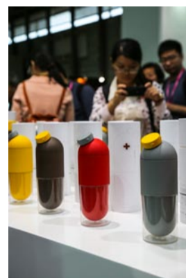
充满创意的胶囊式水杯