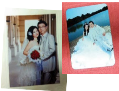
▲在金薇成功牵手,现已步入婚姻殿堂的男女会员

公司地址:徐汇区斜土路1480弄33号新徐汇商务楼205室(近大木桥路) 电话:64430851, 54961246