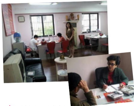
▲红娘老师在耐心等待客户