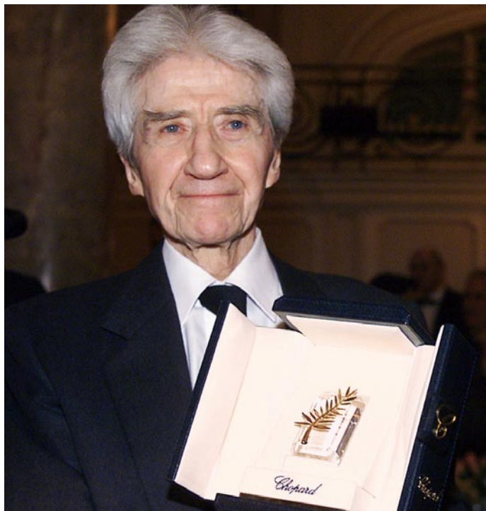
主角 | Lead