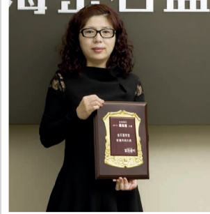
金石盟产品总监获奖