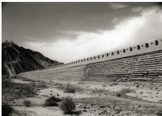
比尔波特在彩云之南、丝绸之路时，途经麦积山、嘉峪关长城、喀什库尔干等著名地标，并和当地居民留下了珍贵的影像画面。