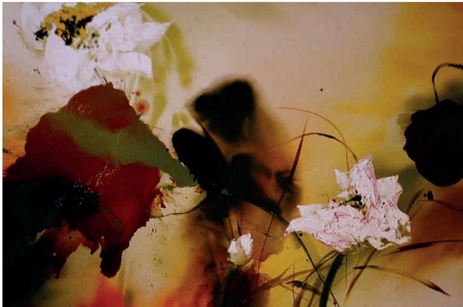
范少华 《金堂照灼》油画