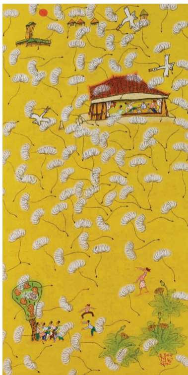
Choi, Sung-Hwan 《春》综合材质

2013上海艺博会，是一场群聚世界各地画廊的嘉年华，有超过150家的画廊以及5千多件的国画、油画、版画、雕塑、摄影、陶瓷等艺术品璀璨登场，相信能让各个层次的消费者在消费的过程中渐渐爱上艺术，在挑选艺术品的同时，感受到拥有艺术的喜悦与快乐！