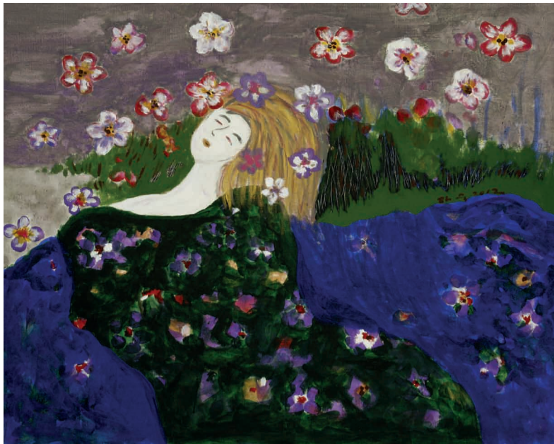
An, Dasuk 《无题》布面丙烯