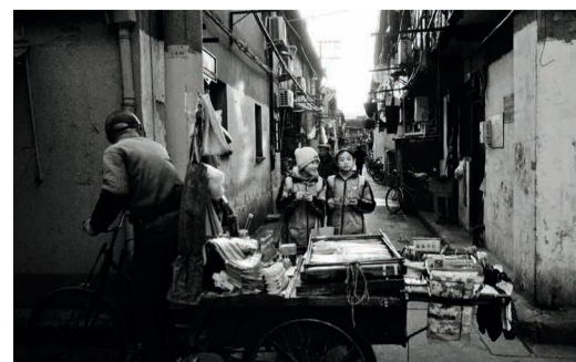
放学啦·天灯路引线附近