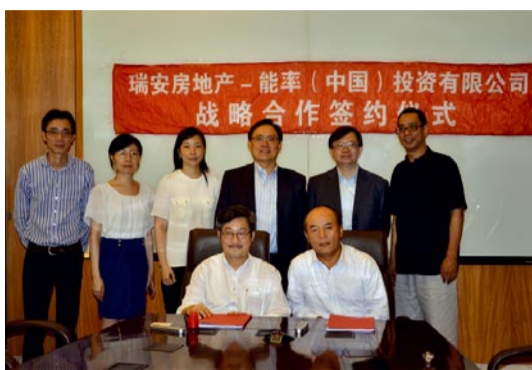
瑞安集团与能率（中国）投资有限公司相关高层领导合影

品质源自细节。除了提供高品质的产品外，对于每一个项目，从图纸设计、管线排放、机器安装、项目验收、维修保养等每一环节，能率都会安排专业的队伍跟进，确保项目的顺利施工，用户的正常使用。