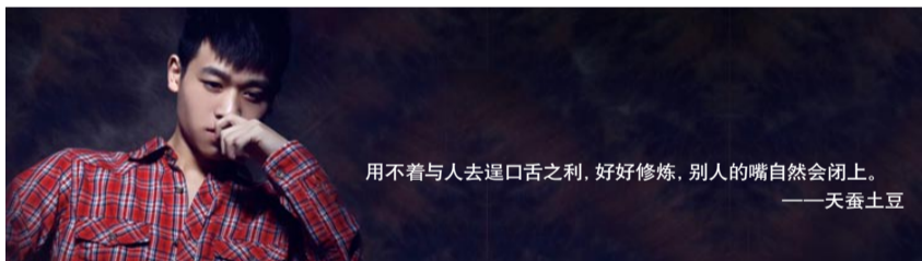
用不着与人去逞口舌之利，好好修炼，别人的嘴自然会闭上。 ——天蚕土豆