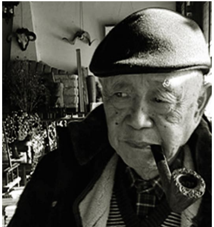
主角 | Lead