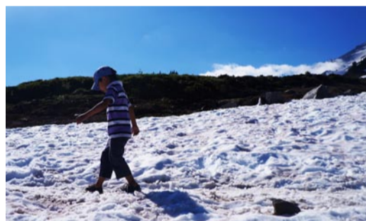
穿着短袖，踏着白雪，穿越季节的界限。

在烈日蓝天下，我伫立着，直面这令人叫绝的雪山美景，震撼之余，还是感觉不真实：雷尼尔雪山真的一片白雪覆盖，但山中却是漫山遍野的绿色松林，林间，成片成片的各色野花正竞相摇曳开放，相衬着皑皑雪山，五颜六色，万紫千红，太妙不可言了！我们开始沿着山路登攀了，爬了没多高，就已经头顶烈日，脚踏冰层，远看野花弥漫山谷，近看白色冰雪，寒而不冷，有点凌乱。每深吸一口气，凉凉的新鲜空气沁入心脾，顿觉心旷神怡。山路漫漫，爬到高处，游客逐渐变少，看着登顶之人远去的背影慢慢消失，山道上不闻人语声了，四周一下变得万籁俱寂，错乱不真实之感竟然又涌上心头。不敢断言自己身在何处了？！再爬行一段山路，从前仅在美妙歌声中传唱的高山野百合、蓝色的鲁冰花伴我前行一路。男女老幼对雪山野花美景都完全没有抵抗力，空灵中自成奇景，此处无声胜有声！