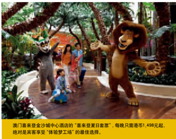
澳门喜来登金沙城中心酒店的“喜来登夏日套票”,每晚只需港币1,498元起,绝对是宾客享受“体验梦工场”的最佳选择。