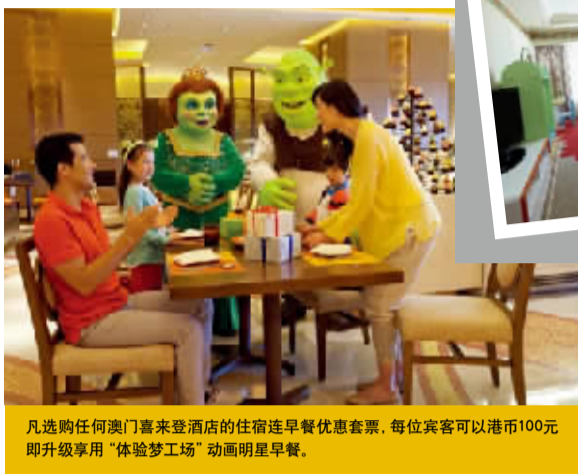
凡选购任何澳门喜来登酒店的住宿连早餐优惠套票,每位宾客可以港币100元即升级享用“体验梦工场”动画明星早餐。