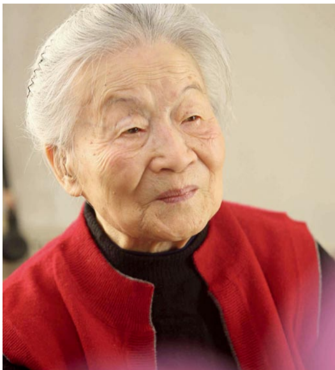
主角 | Lead