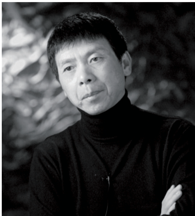
主角 | Lead