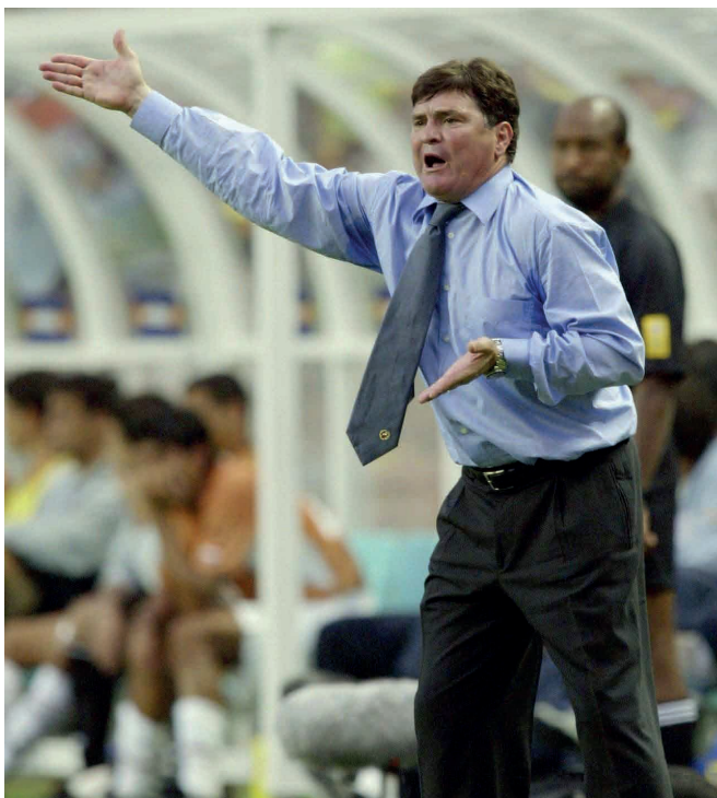
主角 | Lead