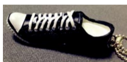
日本某品牌定制U盘