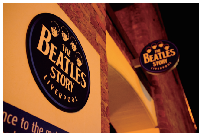
甲壳虫乐队的元素无处不在。