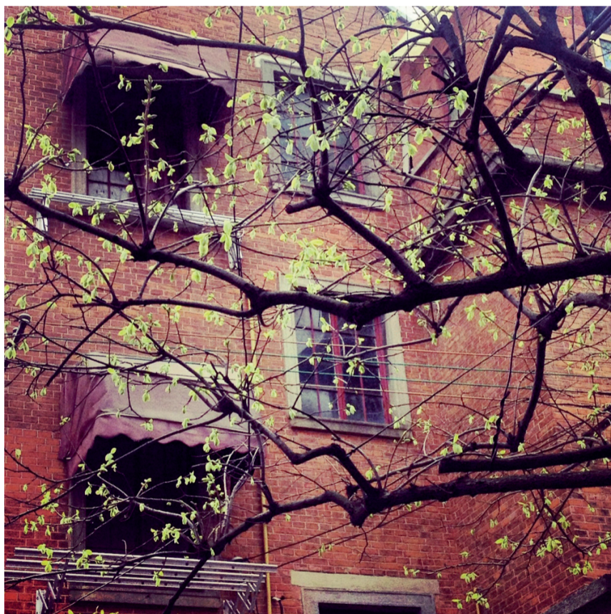
从香港的初夏回到上海的春天，静安别墅的枝条发芽了。