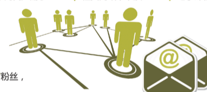
制图 | 陆楠祎