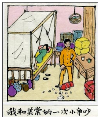
我和美棠的一次小争吵