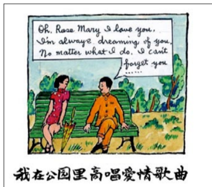
我在公园里高唱爱情歌曲