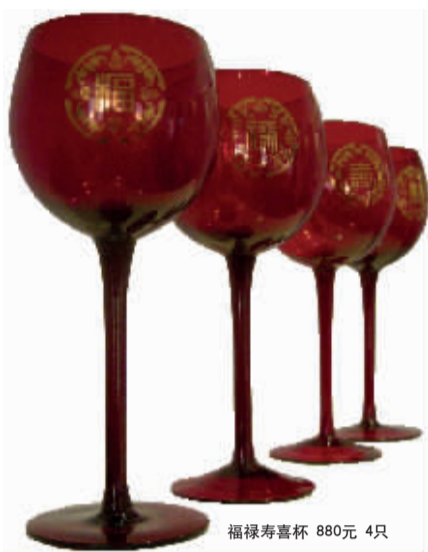
福禄寿喜杯 880元 4只

苹果的工业设计总监曾说：“我很享受打开包装的过程。一旦拆包被设计成一种仪式般的程序，产品也就变得特殊起来。”这款由梵谷设计的锦绣芳华系列的漆器盒就是这样一个华丽的“包装”。该系列漆器盒在设计上使用了中华民族独特文化内涵的盘扣，设计师将盘扣用于漆器镶嵌，赋予了各种美好吉祥的意义。可将一张带有意义的贺卡或具有象征意义的物件放在盒中，在TA打开盒的一瞬间，你送祝福的仪式就被开启。