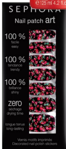
丝芙兰艺术美甲贴