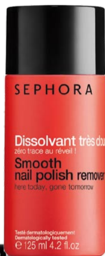
丝芙兰无痕洗甲液

与“免洗”一样, 美甲贴相较于指甲油更能满足宅女们的美丽需求。它有DIY甲油无法达到的富有艺术感的炫彩效果, 使用起来更加方便、简洁, 而效果毫不逊色。如今像丝芙兰所出的美甲贴已经可以做到无需晾干, 无需修正, 直接贴在指甲上就能有近十一天色泽丰盈的美甲妆效。但是, 在使用美甲贴之前, 也是有功课需要做的。想要贴上的美甲更服帖、舒适, 使用前为指甲抛光必不可少, 尤其是指甲面不平整者。市面上有专门的指甲抛光棉, 既能修整出完美的指甲形状, 又能抛光指甲表面, 还可以使指甲表面更闪亮。宅一族的你, 是否知道这些呢?