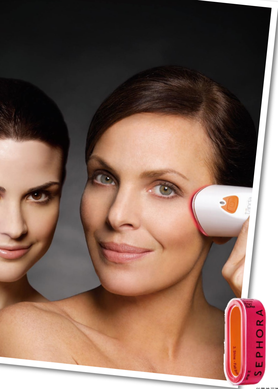
丝芙兰三面抛光棉