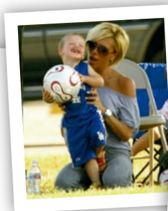
孩子和老公 是辣妹不可 缺少的街拍 工具

虽然，维多利亚的烦恼不少，但她也实在头脑十足，早早为一家人的后路埋下了伏笔，不然，等到别人发现他们已经无料可爆，再来补救，黄花菜都要凉了。